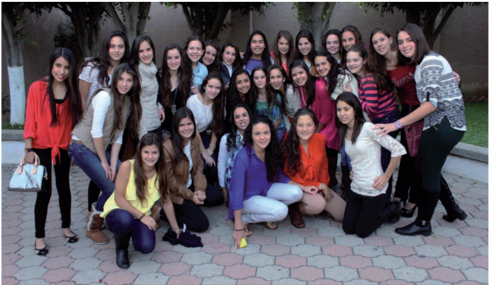
Chicas Cotillón 2013