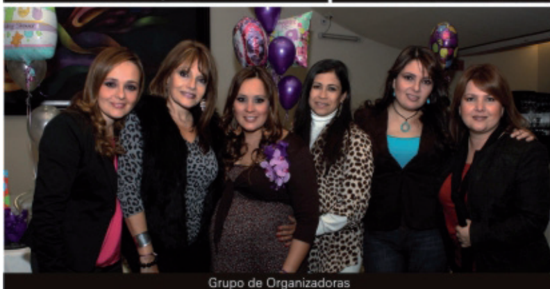
Grupo de Organizadoras