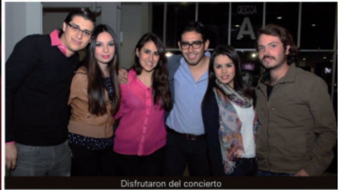
Disfrutaron del concierto