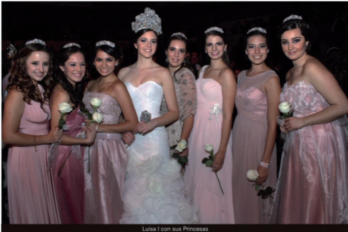
Luisa I con sus Princesas