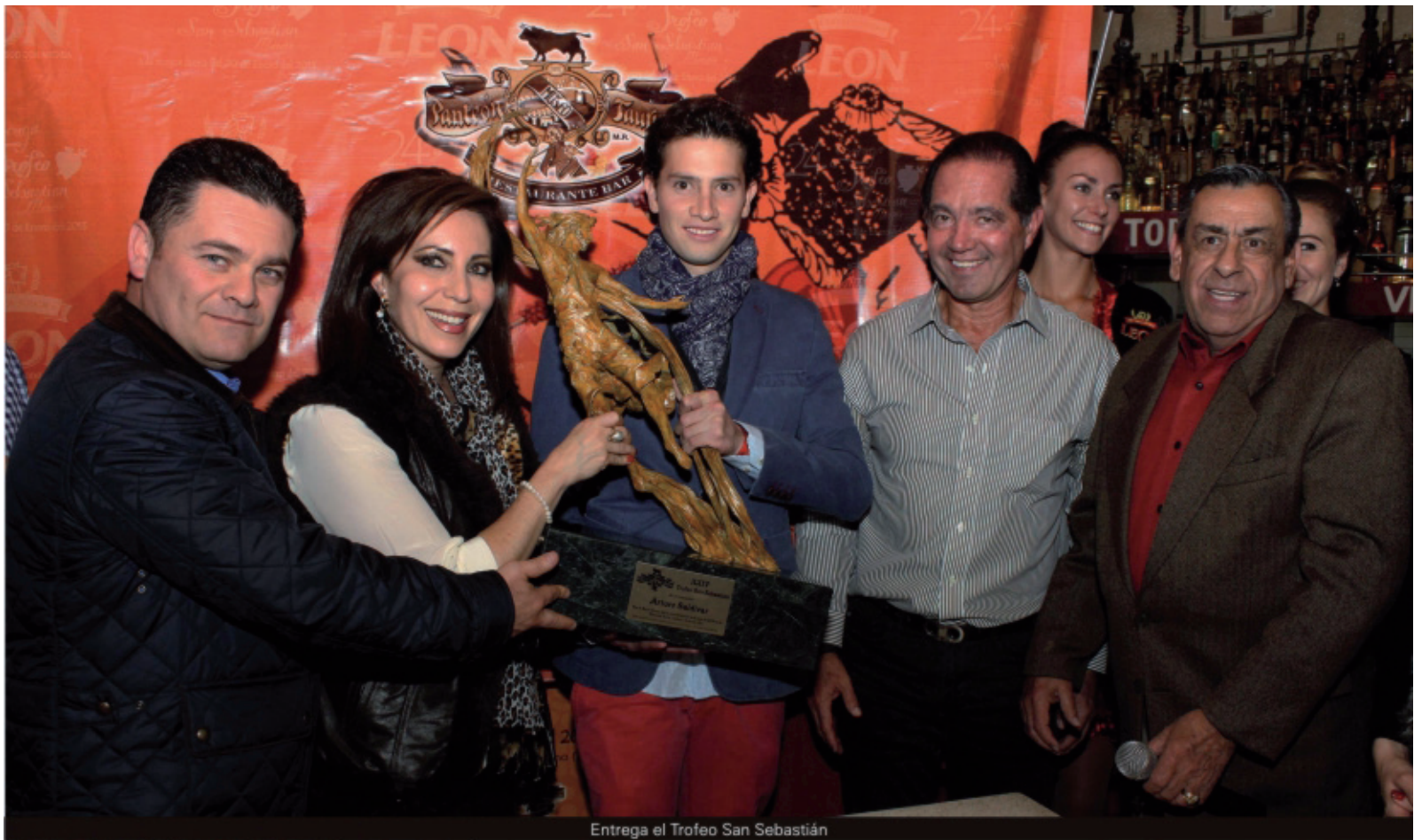
Entrega el Trofeo San Sebastián