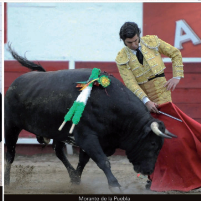
Morante de la Puebla