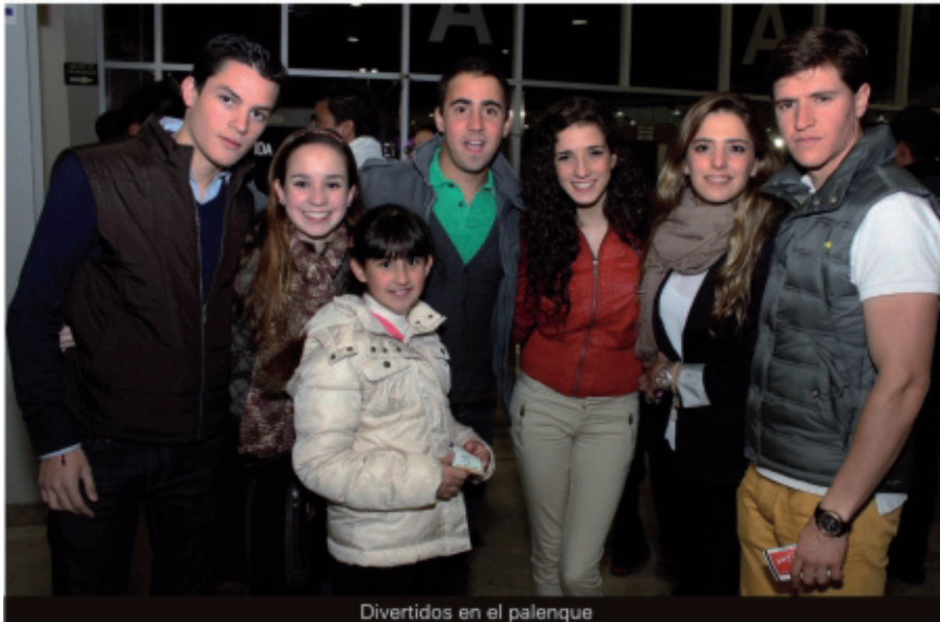
Divertidos en el palenque