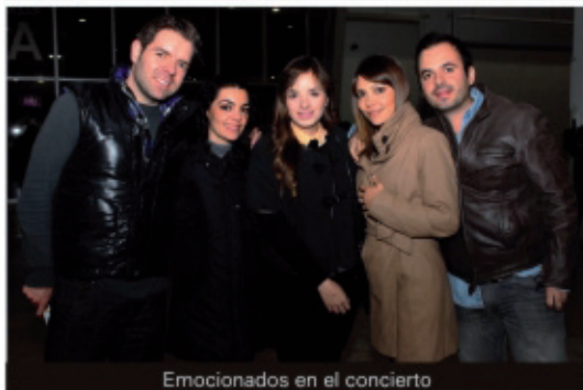
Emocionados en el concierto

La banda de pop rock alternativo Zoé enloqueció a todos sus fans con la presentación que hicieron en el Palenque de la Feria de León 2013, el cual tuvo un lleno total ya que nadie quería perderse una noche de rock al sonar temas como: "Labios rotos", "Reptilectric", "Vía Láctea", "No me destruyas" y "Soñé", canciones que los han hecho acreedores y nominados a varios galardones importantes como lo son los Premios Latin Grammy, Lo Nuestro y Telehit.