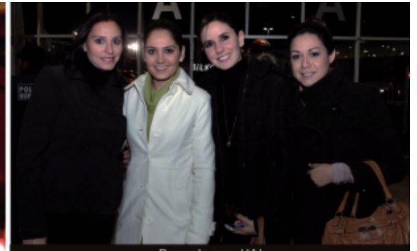
Posando para HAI