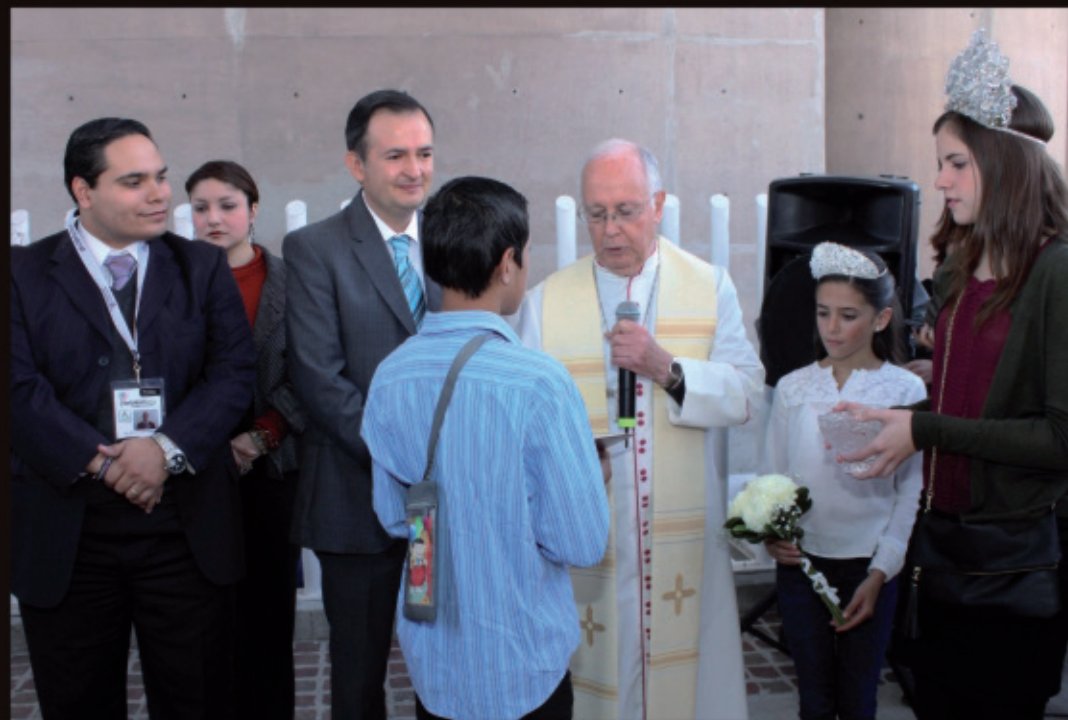
Bendicen la Feria