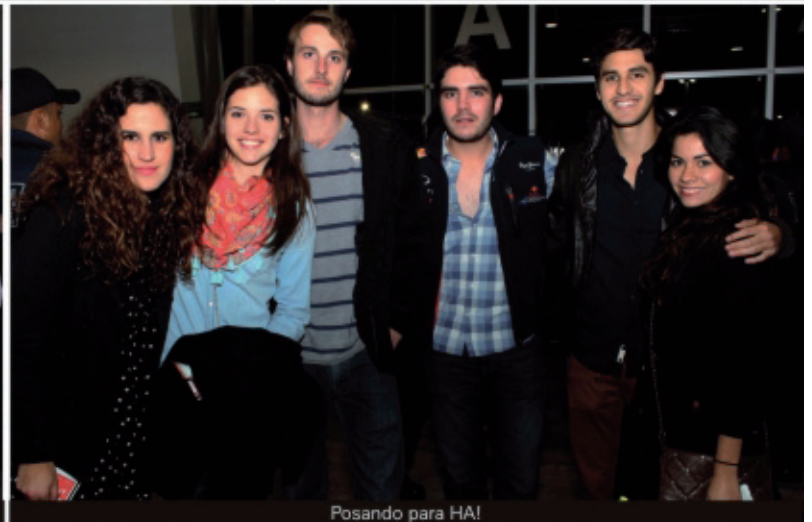
Posando para HA!