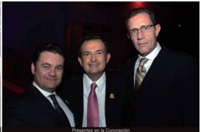
Presentes en la Coronación