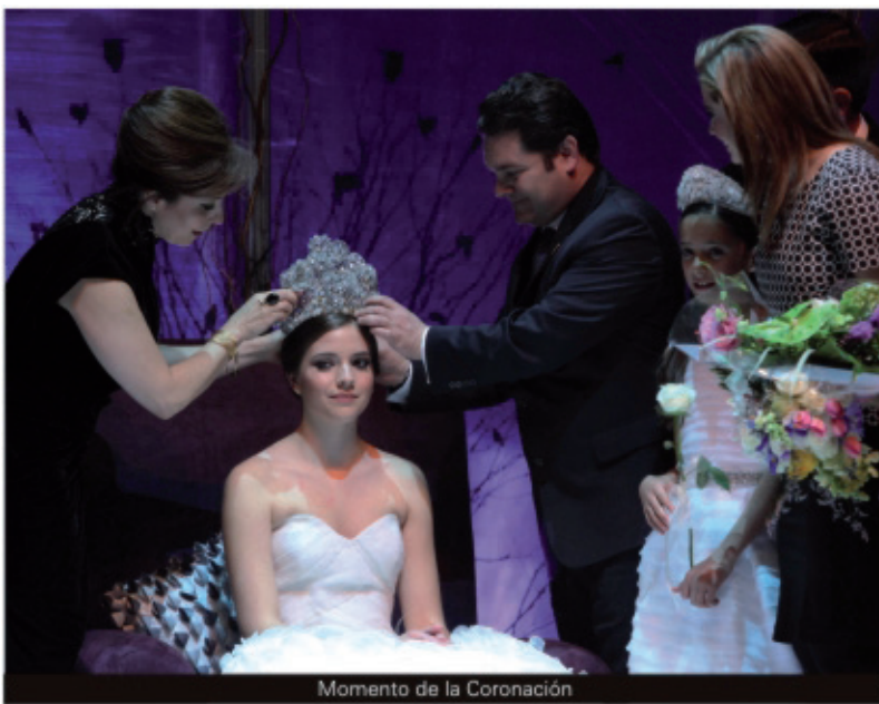
Momento de la Coronación