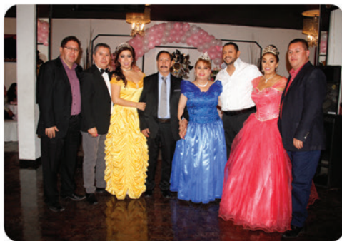
Familia Chávez Negrete