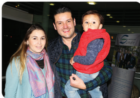
Familia de Alba de León