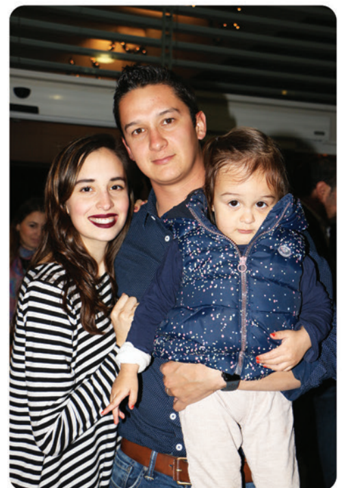
Familia de Alba