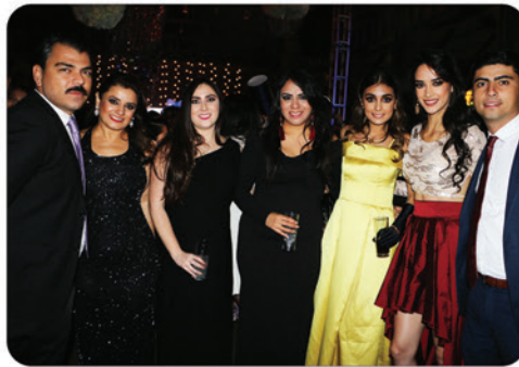
Los graduados, durante el brindis