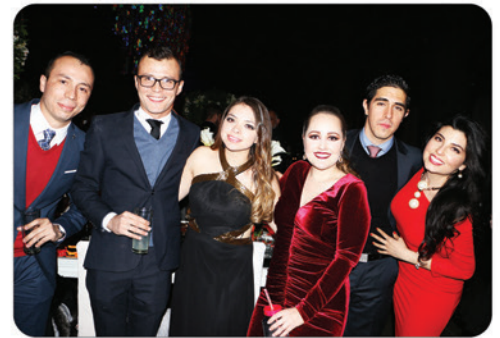
Disfrutando excepcional velada