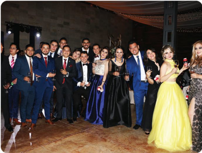
Alumnos de la carrera de Derecho