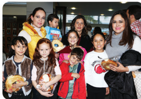
Las familias disfrutando el festejo alusivo al "Día de Reyes"