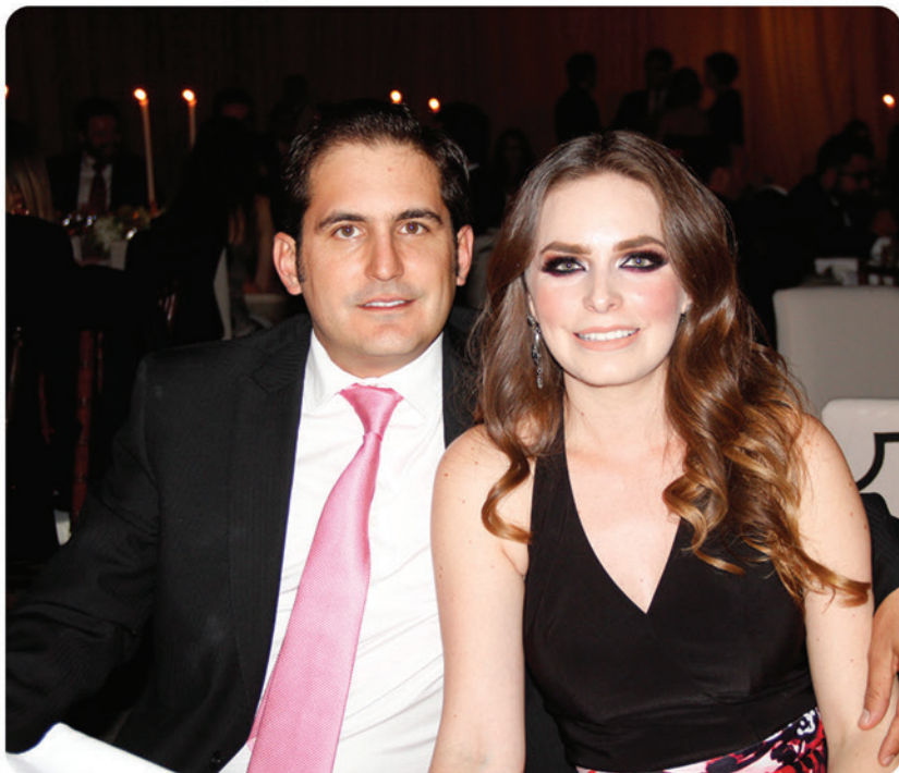
Javier y Lula