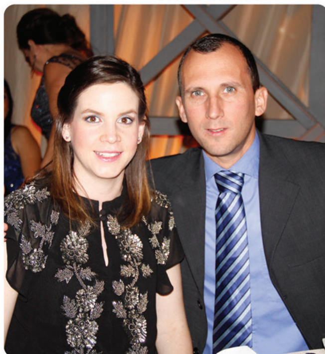
Pau y Paul