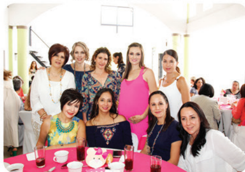
Invitadas de Sofía