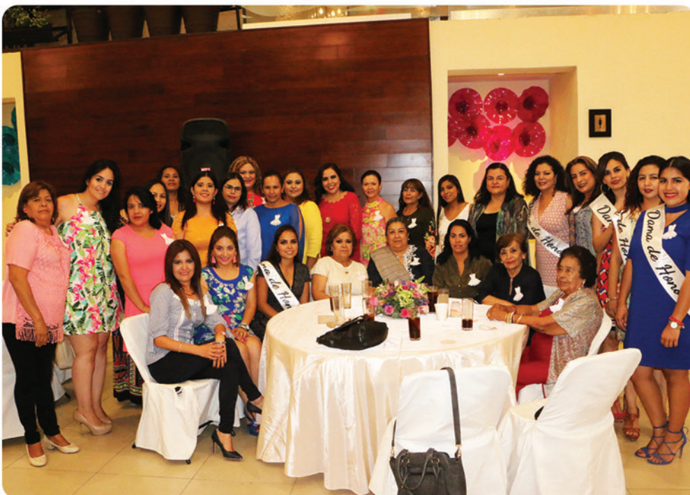
Familiares y amigas de la Festejada