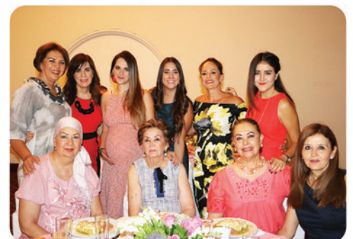
La festejada con sus invitadas