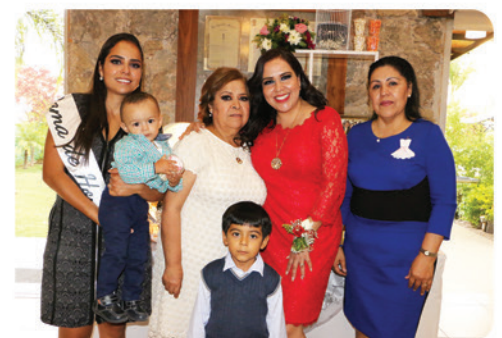
Familiares de la festejada