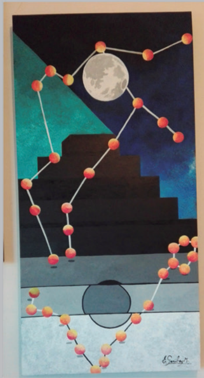
MEXTLI Acrílico sobre triplay