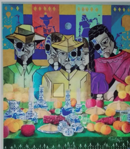
ALTAR DE MUERTOS Acrílico sobre tela