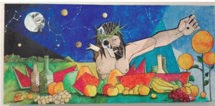
BODEGÓN DEL CRISTO ROTO Acrílico sobre triplay