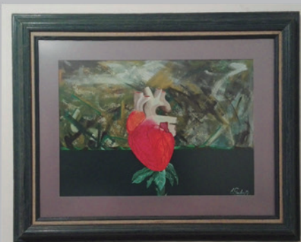
FLOR DE CORAZÓN Acrílico sobre cartón