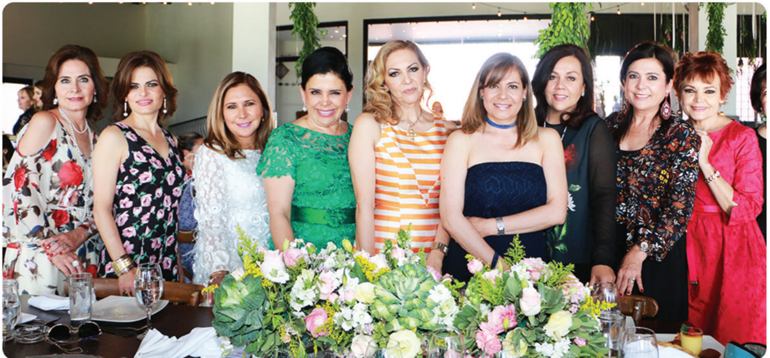
Familiares y amigas de la festejada