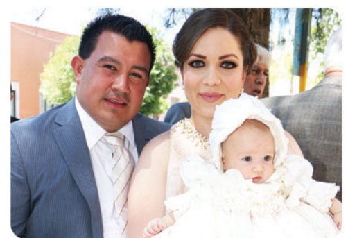
Familia Palos Flores