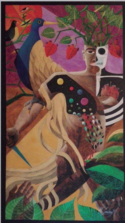
RENACER Acrílico sobre triplay