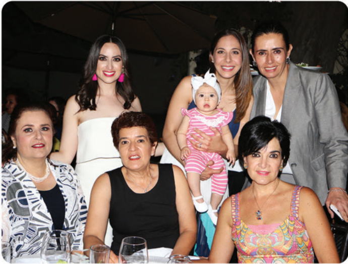
Sofia con sus invitadas