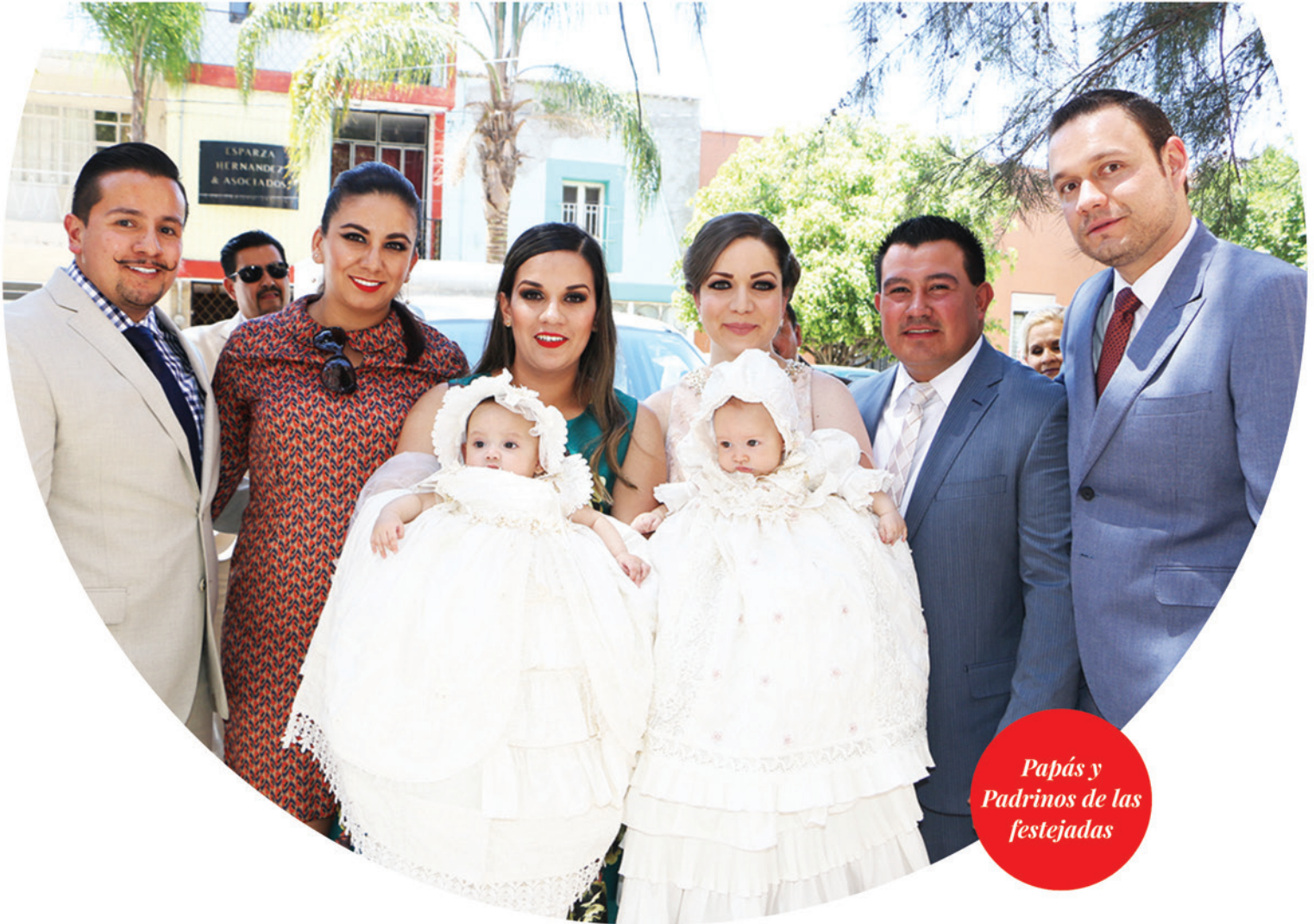
Papás y Padrinos de las festejadas