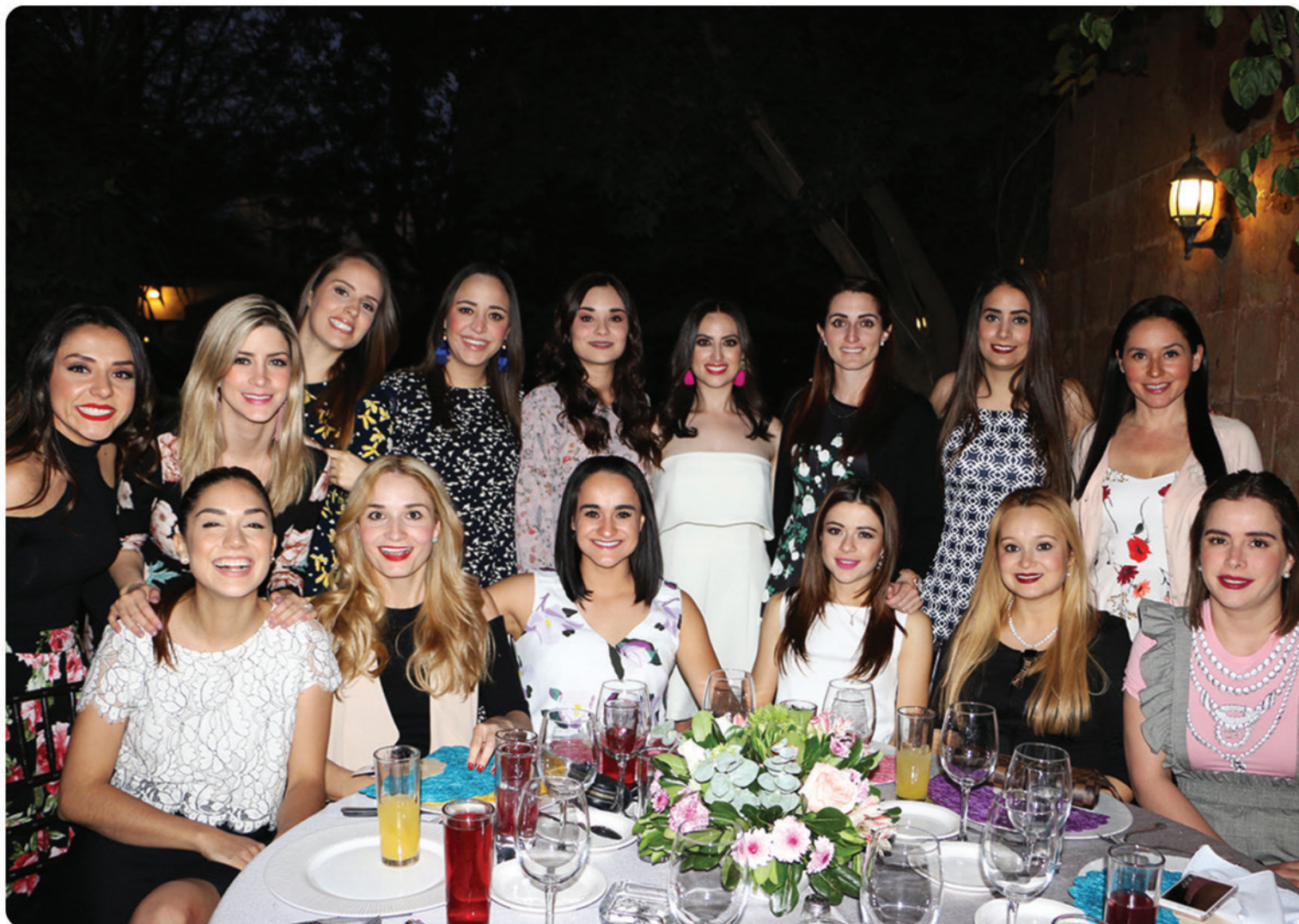
Amigas de Sofía