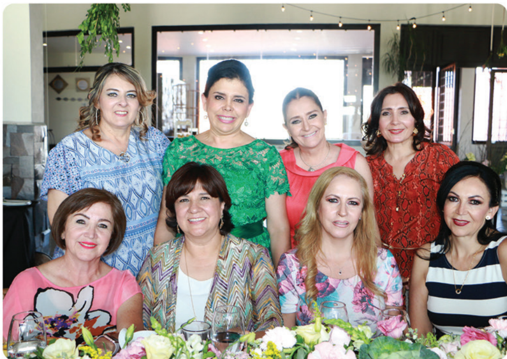
Las invitadas acompañaron a la festejada en este día tan especial

Plaza San Julián, ubicada en Sierra Morena 401, Fraccionamiento Los Bosques, Esq. con San Julián Citas (449) 688-31-93