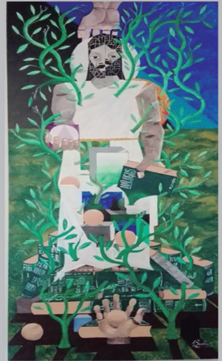
EL FILÓSOFO Acrílico sobre triplay