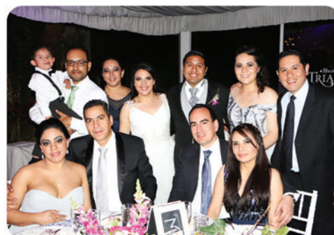
Los recién casados recibieron felicitaciones