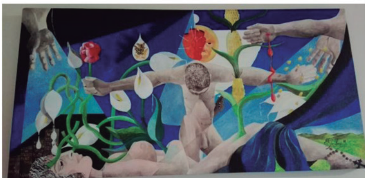
EL AMOR SANA Acrílico sobre triplay

Facebook: Ernesto I. Garibay Mora Gallery