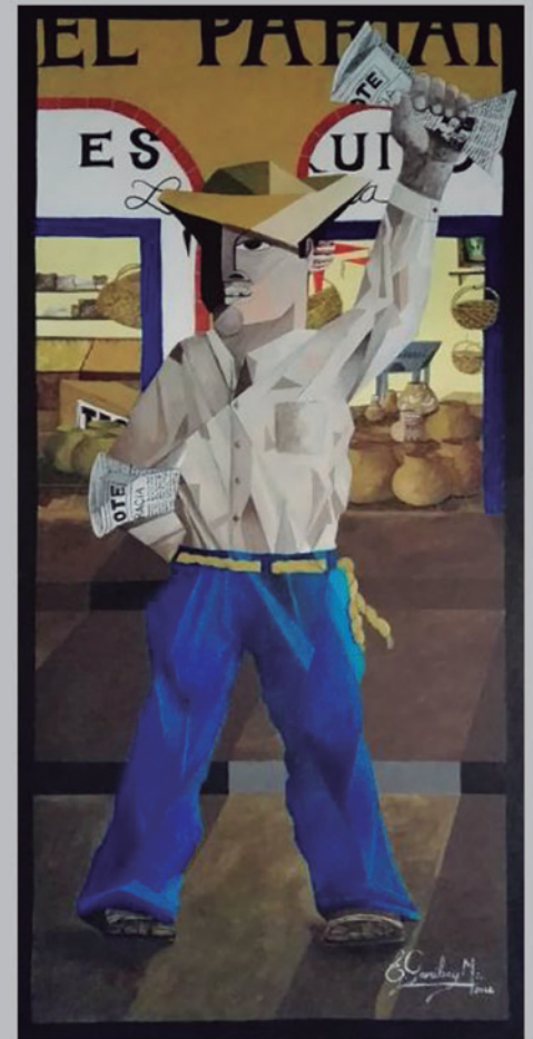
EL VOCEADOR Acrílico sobre triplay