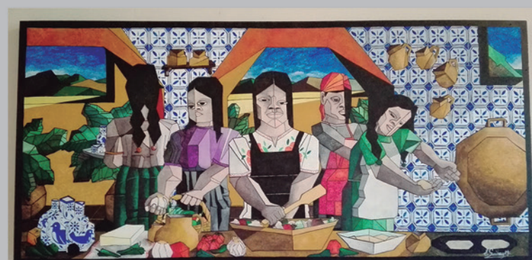
LA COCINA Acrílico sobre triplay