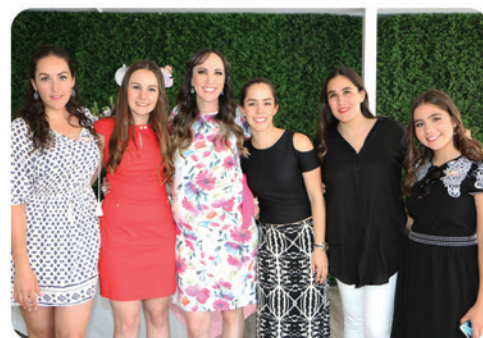
La festejada con sus amigas