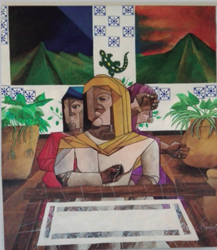
LAS TEJEDORAS Acrílico sobre triplay