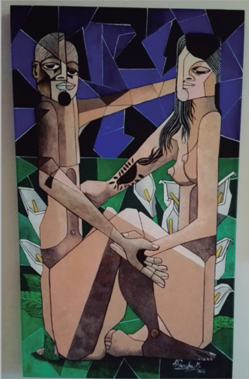
INTEMPERIE Acrílico sobre tela