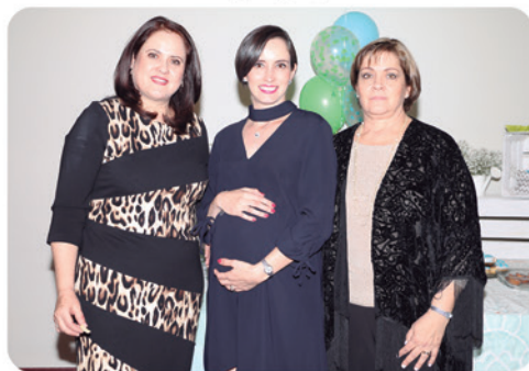
La festejada con su suegra y su mamá