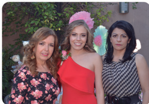
Mariana acompañada de su mamá y la mamá de su futuro esposo