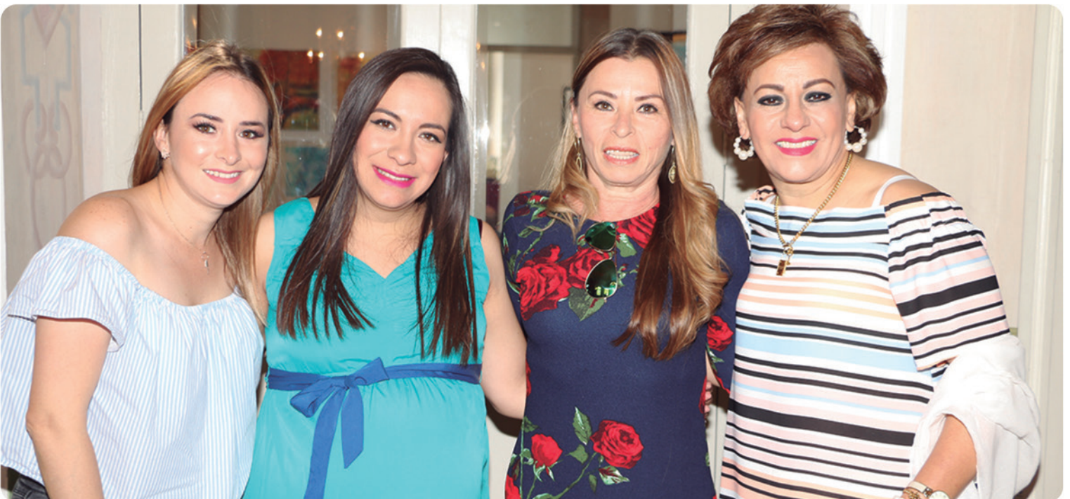
La festejada con sus invitadas