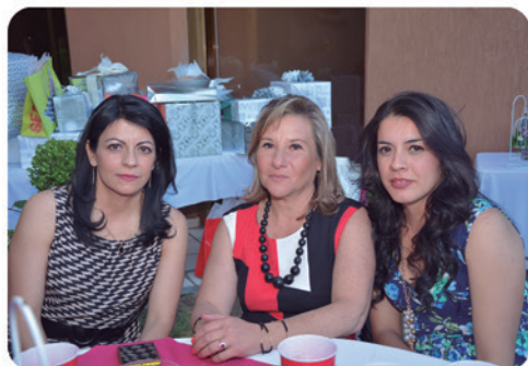
Familiares de Mariana la pasaron muy bien