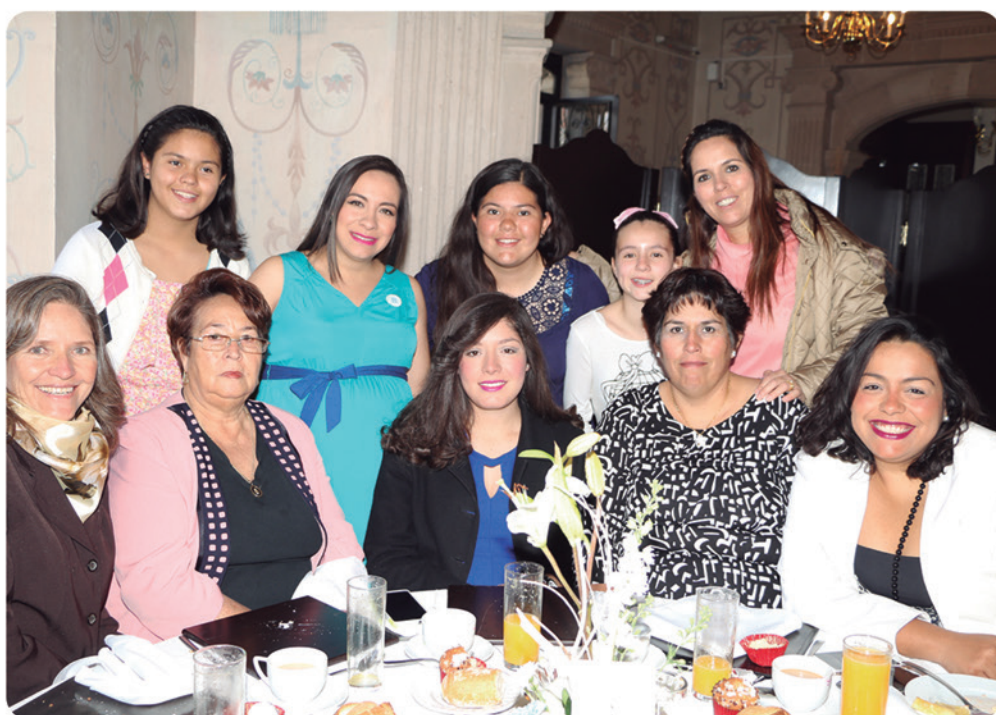
La festejada con sus invitadas