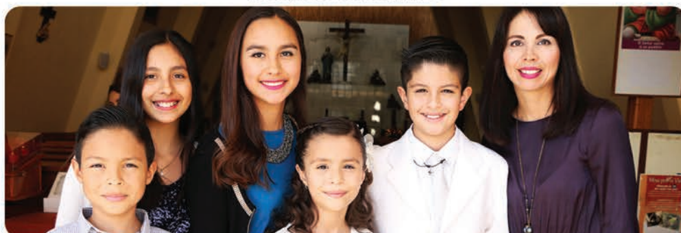
Los festejados con su tía y primos