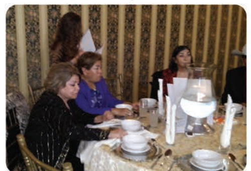
Carmelita también estuvo presente en éste día especial