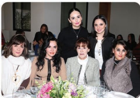
Las invitadas acompañaron a la festejada a su convivio