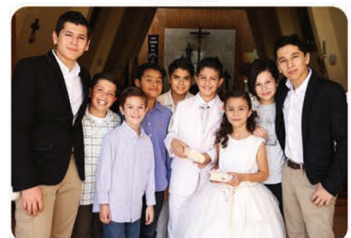
Los festejados con sus amigos y primos