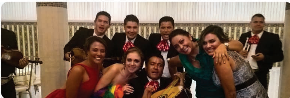
Todos la pasaron muy bien