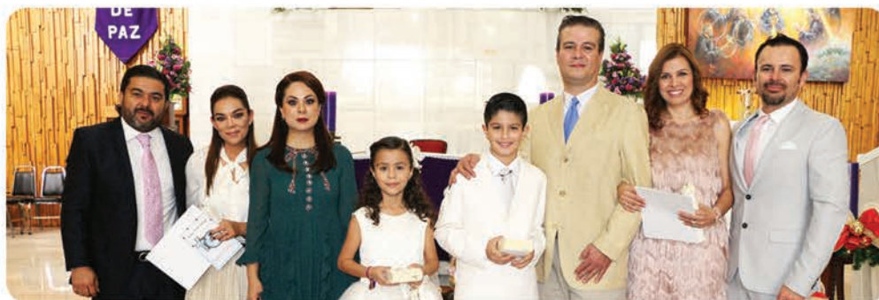
Los festejados con sus papás y padrinos