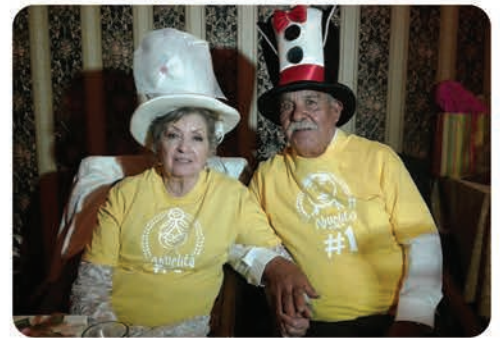
El sentido del humor presente en los novios