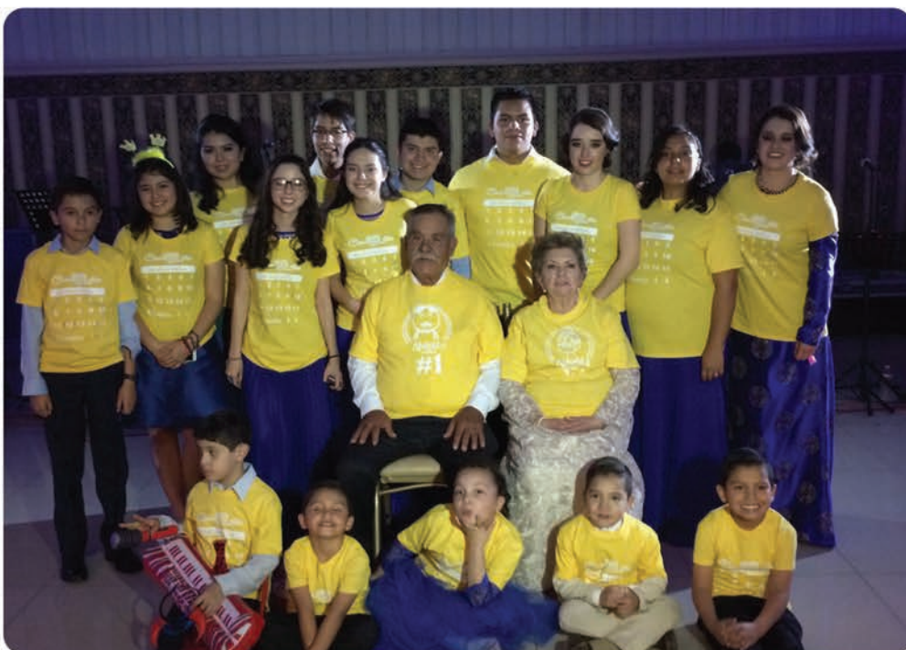
Nietos y Bisnietos