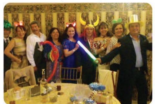
Momentos de diversion pasaron los invitados