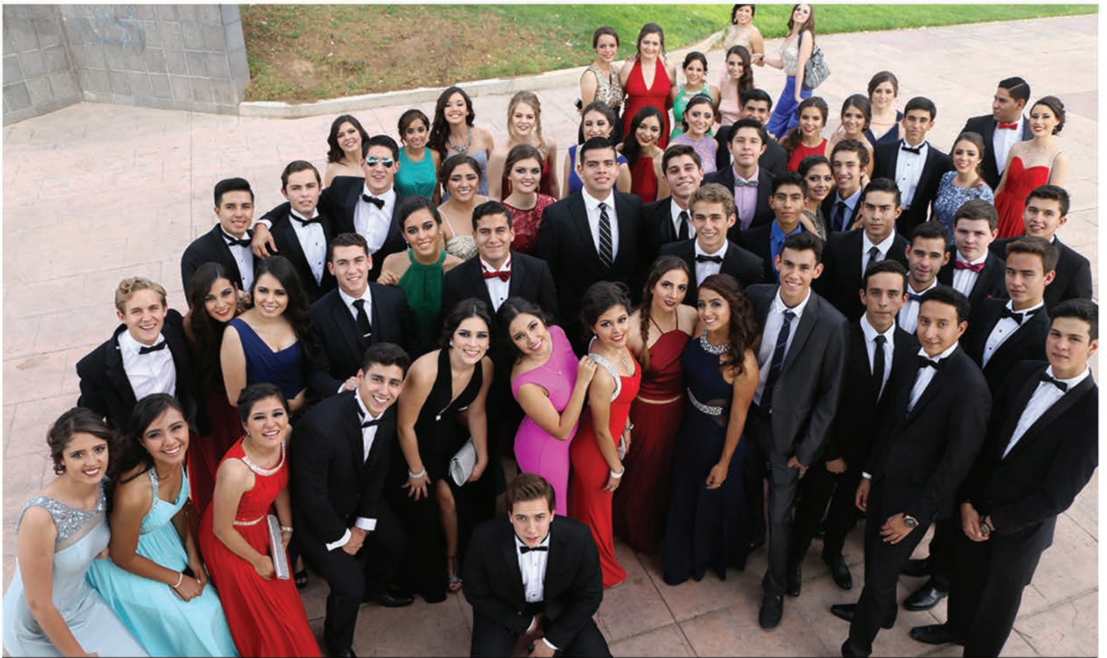
Alumnos del Tec de Monterrey