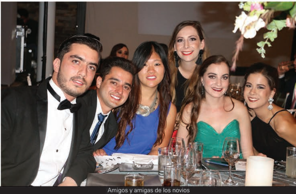
Amigos y amigas de los novios