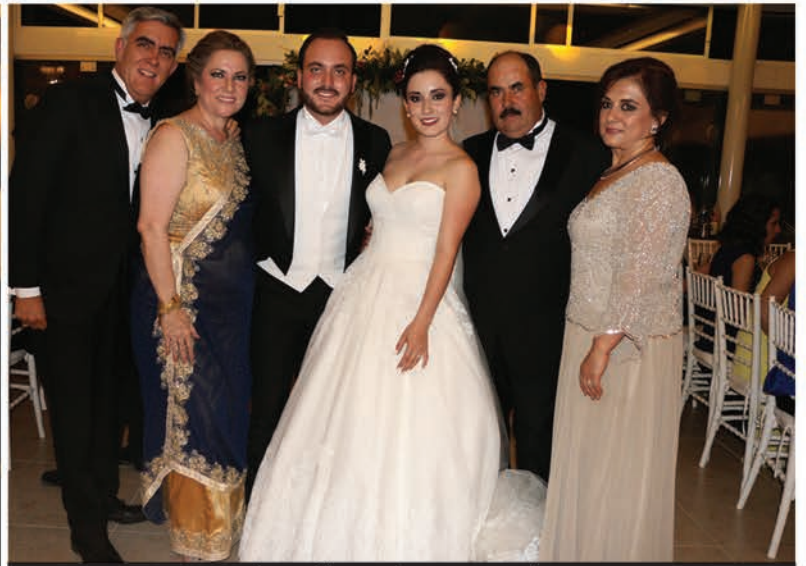
Los recién casados con sus papás