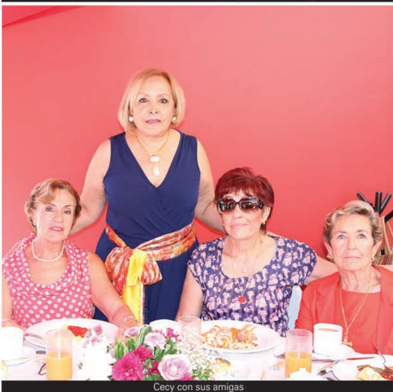
Cecy con sus amigas