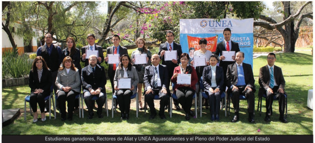
Estudiantes ganadores, Rectores de Aliat y UNEA Aguascalientes y el Pleno del Poder Judicial del Estado

Durante el desarrollo de la etapa nacional en las Salas de Oralidad del Tribunal Superior de Justicia del Distrito Federal, el destino volvió a enfrentar a UNEA Aguascalientes con su adversario en la etapa regional, Tamaulipas, ante quienes, con criterio de jueces más ortodoxos y estrictos, la Universidad de Estudios Avanzados obtuvo el triunfo el 12 de Febrero de 2016.