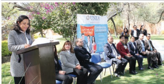
Mensaje de la Rectora de Zona, Rocío Oliver López ante los Magistrados del Poder Judicial del Estado