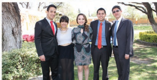
Los estudiantes triunfadores del Concurso Nacional de Juicios Orales organizado por la CONATrib