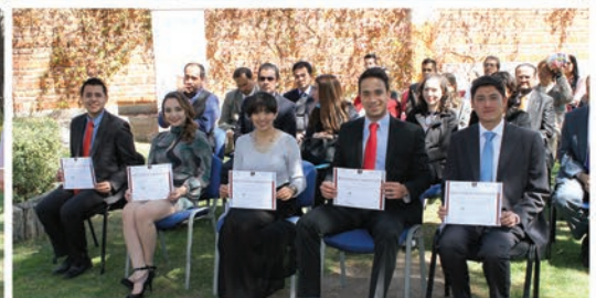
Estudiantes triunfadores del Concurso organizado por la CONATrib tras recibir su reconocimiento por parte de la UNEA Aguascalientes