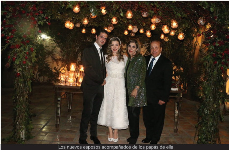
Los nuevos esposos acompañados de los papás de ella