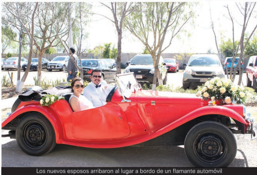
Los nuevos esposos arribaron al lugar a bordo de un flamante automóvil